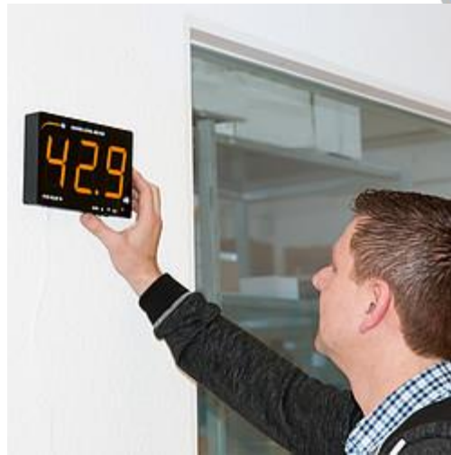
Geluidsmeter in gebruik