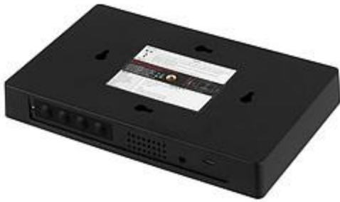
Achterzijde van het apparaat